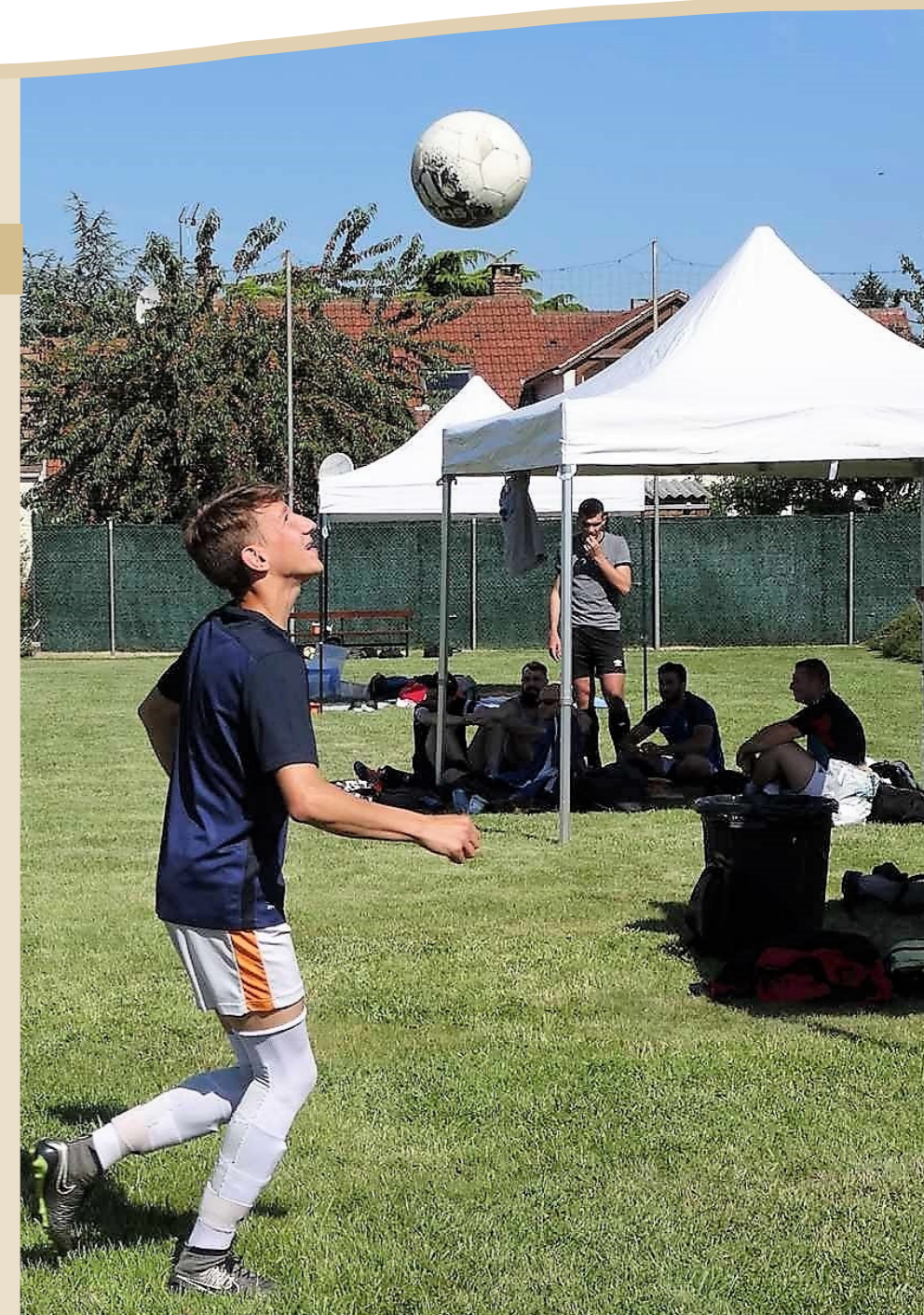
TOURNOI DE FOOT le 17 juin